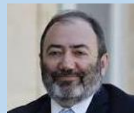
François BRAUN Ministre de la Santé et de la Prévention