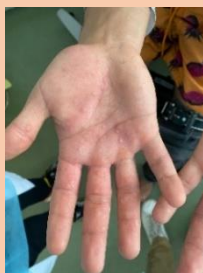
SMIT Saint Antoine, juin 2022